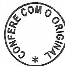
Rita Helena Libório Controlador Externo 5ª Controladoria/TCM-PA